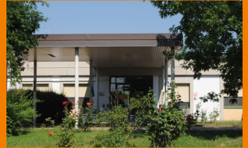
Casa "Cassiano Tozzoli" e Centro Diurno Via Venturini 16/e Imola